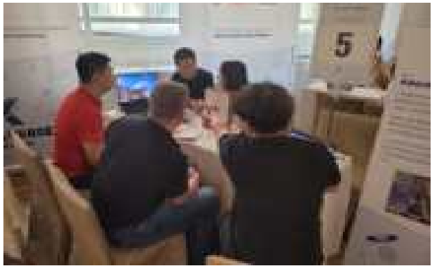
DAY3 IR 피칭 및 투자사 밋업