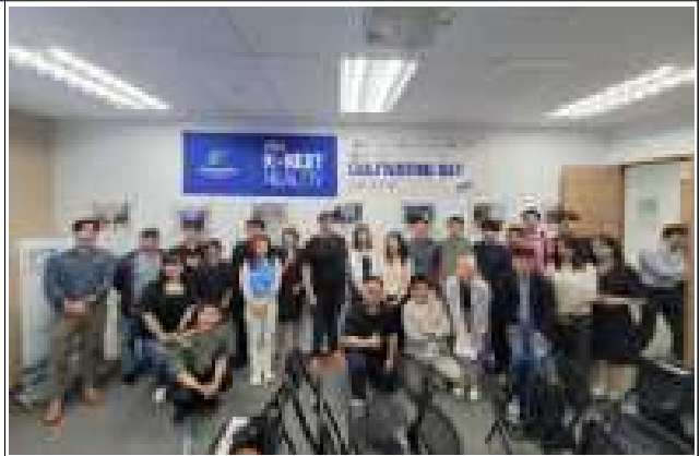
DAY1 싱가포르 GTM 전략 세미나 및 그룹 네트워킹