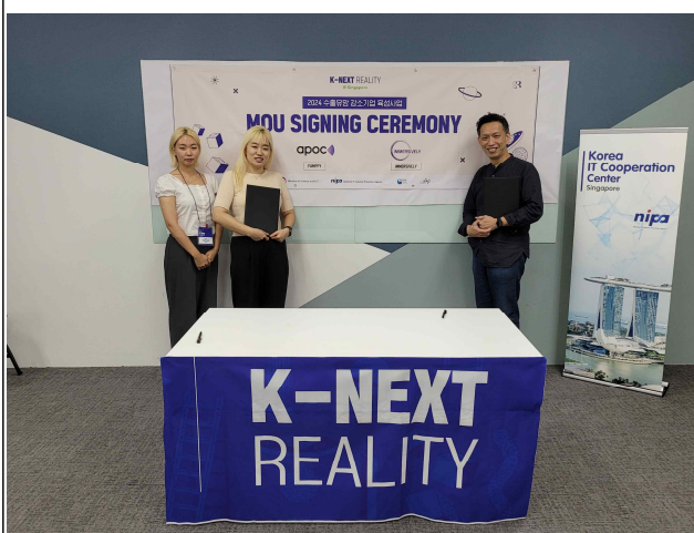
팜피주식회사 - iMMERSiVELY