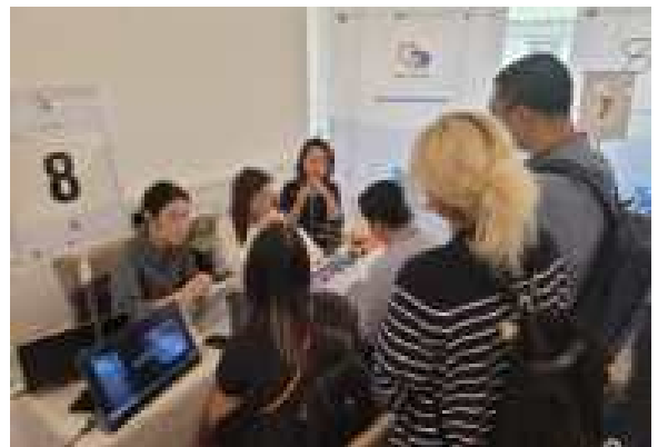
DAY2 쇼케이스 및 비즈니스 미팅