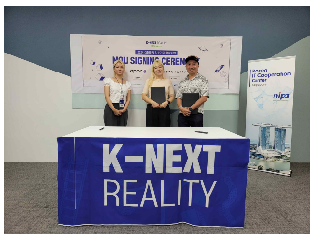
팜피주식회사 - Xctuality