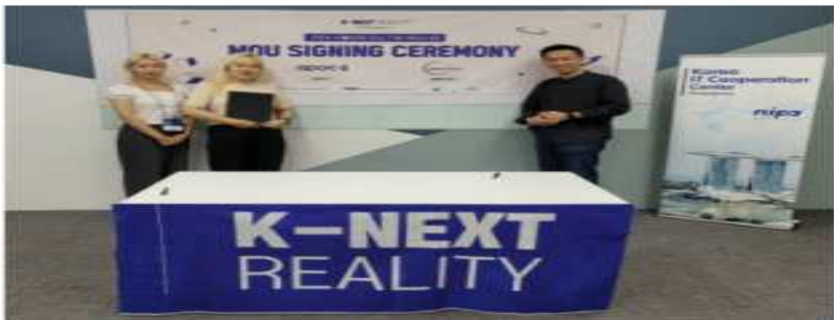
팜피가 NIPA 싱가포르 IT지원센터에서 현지 기업 iMMERSiVELY와 MOU를 체결한다

팜피는 K-NEXT Reality@Singapore 프로그램을 통해 싱가포르 현지 기관, 바이어, 투자사를 대상으로 자체 개발한 XR 및 AI 엔진을 탑재한 인터랙티브 콘텐츠 플랫폼 'APOC (아록)'을 선보였으며, 싱가포르에서의 시장 확장 가능성과 기술력에 대해 호평을 받았다.